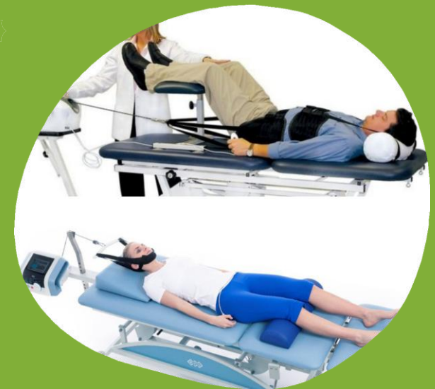
RSUD Panembahan Senopati