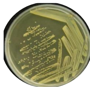
Gambar 2 Koloni kuman (P 2 ) yang tumbuh pada media NAP