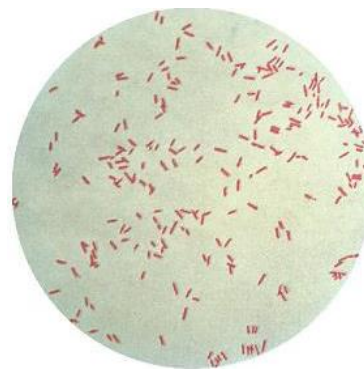
Gambar 5 Hasil pengamatan preparat sampel P 1