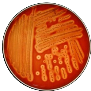
Gambar 4 Koloni Kuman (P 2 ) yang tumbuh pada media BAP