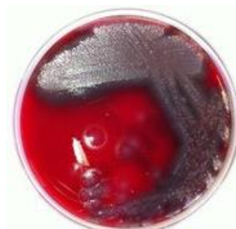
Gambar 3 Koloni kuman (P 1 ) yang tumbuh pada media BAP