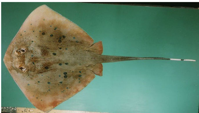
Gambar 3. Neotrygon kuhlii . (Randall 1997)

Tubuh atau lempengan kepala membulat, moncong pendek dengan sudut melebar. Terdapat bintik-bintik hitam yang menyebar melintang melewati mata (Gambar 3). Warna tubuhnya coklat kemerahan dengan beberapa bintik-bintik biru dan terkadang hitam pada bagian punggung atau dorsal. Panjang ekor hampir sama dengan tubuh, dan mempunyai cincin berwarna