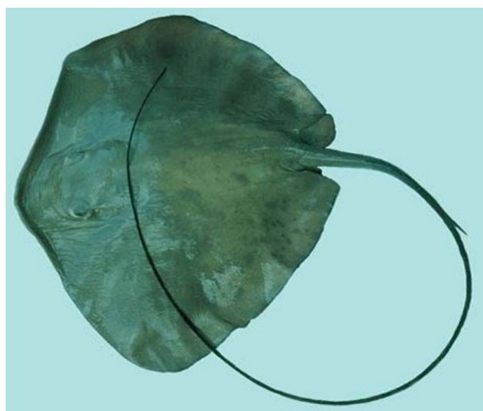
Gambar 5. Pteroplatytrygon violacea . (Randall 1997)

ini berwarna keunguan atau biru gelap sampai hijau pada bagian punggung dan perut. Mendiami perairan laut terbuka, beriklim tropis dan hangat, umumnya pada kedalaman 100 m. Sering dipergunakan jaring insang tuna dan hiu untuk menangkapnya. Makanannya yaitu coelentrata, cumi-cumi, krustasea dan beberapa jenis ikan (Ellis 2007). Koleksi jenis ini berasal dari perairan di Cilacap Jawa Tengah, dengan panjang lempengan tubuh 38,0 cm dan lebar 43,0 cm.