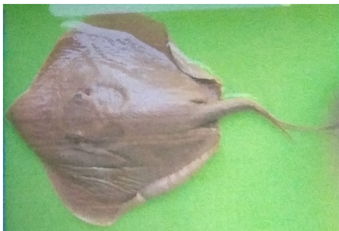
Gambar 4. Pateobatis jenkinsii .

Jenis P. jenkinsii dapat tumbuh dan berkembang sampai 1,5 m (Gambar 4). Pada bagian tengah tubuh dan ekor memiliki deretan baris duri-duri besar. Bentuk cakram sirip dada menyerupai berlian. Tubuhnya bewarna coklat kekuningan, bagian perut keputihan, sedangkan ke arah ekor berwarna coklat polos atau keabu-abuan. Pari ini menghuni perairan dangkal, sampai kedalaman 50 m, dengan dasar berpasir (Allen & Swainston 1988). Umumnya jenis ini memakan beberapa jenis ikan kecil dan krustasea. Pateobatis jenkinsii yang tersimpan di Museum Zoologicum Bogoriense mempunyai panjang lempengan tubuh 24,0 cm dan lebar 37,0 cm.