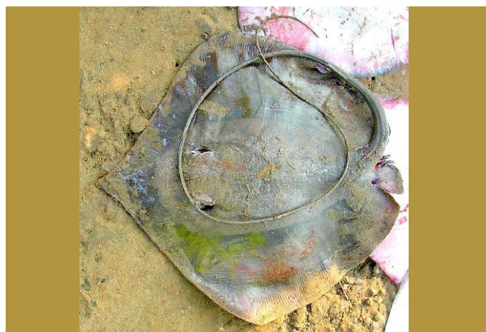
Gambar 7. Telatrygon zugei . (Devarapalli 2007)

berwarna keputihan. Secara umum jenis ini dapat dijumpai berenang bebas di muara-muara sungai atau perairan dengan kedalaman kurang dari 100 m, sambil mencari mangsanya yaitu ikan kecil dan beberapa krustasea (Talwar & Jhingran 1991). Jenis Pari yang terkoleksi berasal dari perairan Cilacap, Jawa Tengah, dengan panjang lempengan kepala yaitu 34,0 cm dan lebar 20,0 cm. Satu lagi berasal dari Teluk Banten, Pandeglang dengan panjang lempengan kepala yaitu 28,0 cm dan lebar 10,0 cm.