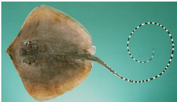
Gambar 2. Maculabatis gerrardi . (Randall 1997)

perairan seperti udang, kepiting dan lobster yang berukuran kecil. Pari M. gerrardi dikoleksi dari di perairan Muara Angke Jakarta Utara memiliki panjang lempengan tubuh 72,0 cm dan lebar 21,0 cm